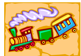
Pie de imagen o gráfico.

"Incluya aquí una frase o una cita del artículo para captar la atención del lector"