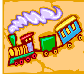
Pie de imagen o gráfico.